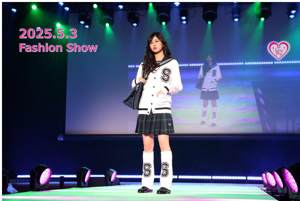
上記は 2025 年 5 月 3 日に実施したファッションショーの画像。