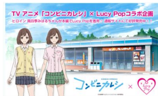
アニメの女子高生役の主人公の衣装をデザイン 取引先：アニメ制作会社様(コラボレーション)

その他、国内外のトップアイドルグループや声優などへの衣装協力実績、コラボ実績など多数あり。