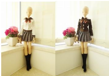
制服デザインの提供とブランド商標を使用許諾 取引先：ドール服メーカー様(ライセンス契約)